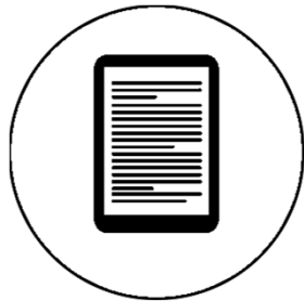
E-Reader außer Kindle